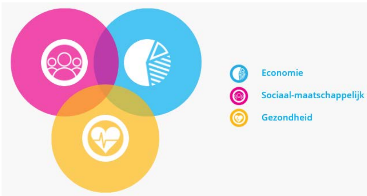
Figuur 1. De drie waarden van sport met centraal de sport zelf (Landelijk Opleidingsprofiel Sportkunde).

Sportkunde is een breed georiënteerde opleiding waarin studenten voorbereid worden om als professional aan de slag te gaan in een zeer divers sport gerelateerd werkveld (bijlage 1). In de voorgaande studie jaren heb je ervaring opgedaan in projecten binnen verschillende contexten die de sport te bieden heeft. Door de combinatie van theorie en praktijk ben je inhoudelijk voorbereid op de belangrijkste vraagstukken in de sportwereld, maar heb je ook verschillende contexten binnen het werkveld leren kennen. Daarnaast heb je deelgenomen aan diverse simulaties en games waarin de complexe werkelijkheid van de sportwereld werd nagebootst. Vanuit deze brede basis wordt het nu tijd om te specialiseren op snijvlakken van de extrinsieke waarden van sport: economie, sociaal-maatschappelijk en gezondheid (Figuur 1). Tijdens het afstudeerprogramma krijg je de gelegenheid om vanuit een brede basis verschillende invalshoeken toe te passen en hierin verbindend op te treden en van directe meerwaarde voor de praktijk te zijn.